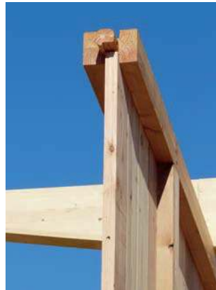
détail de l'âme centrale