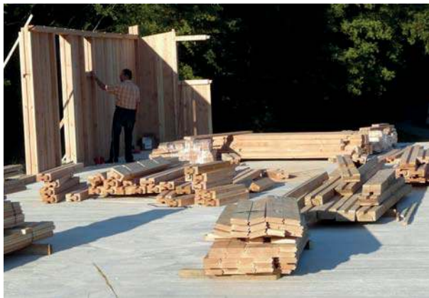
le premier angle d'une maison