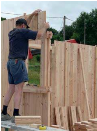
encadrement de fenêtre