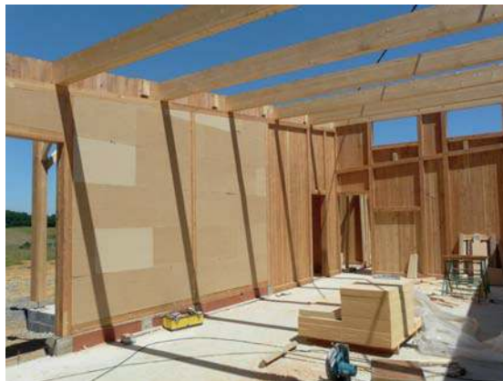
panneaux de fibres de bois insérés dans l'ossature