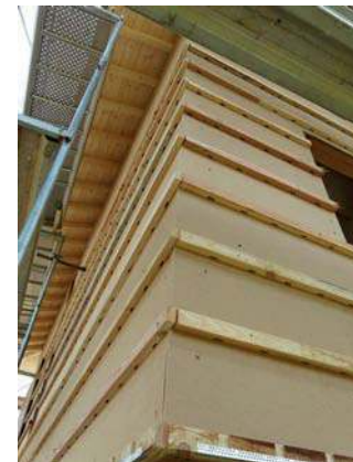
tasseaux avec aération (ventilation du bardage)