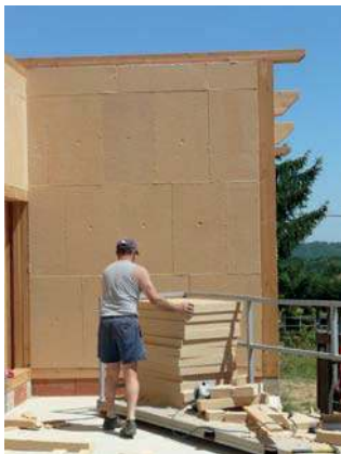
pose des panneaux

Isolation de toiture Des solutions sont proposées selon les spécificités du projet