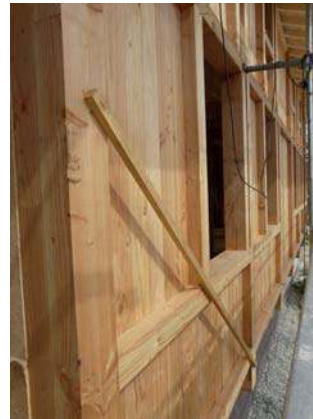
mur avant la pose de l'isolant