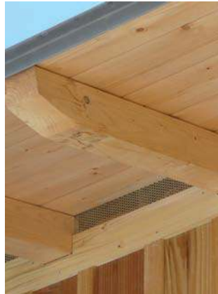
volige et grille anti-rongeurs